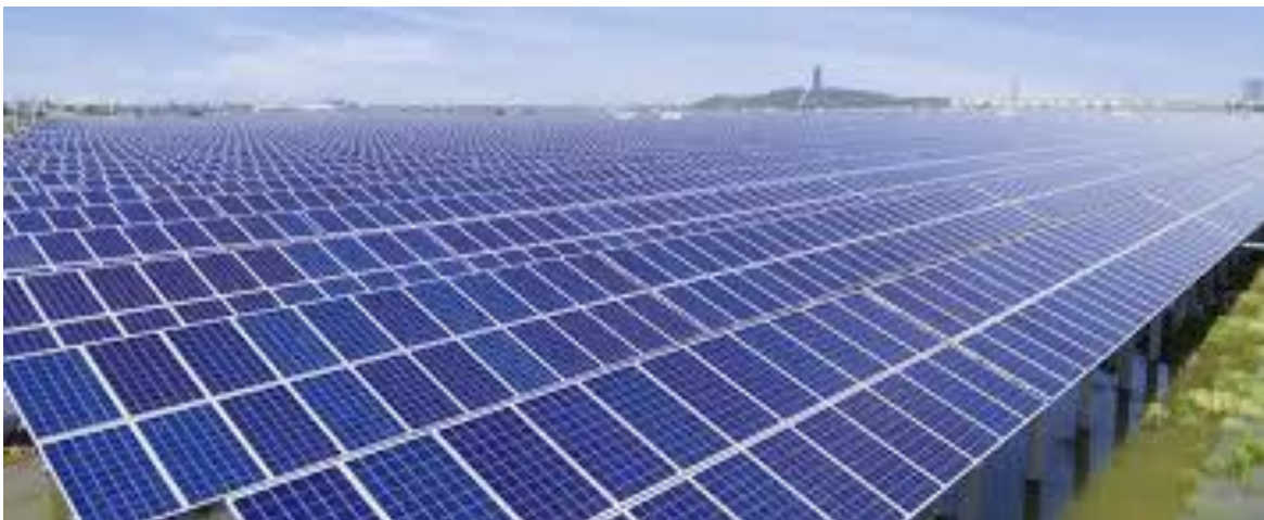
Figuur 3: Zonneparken ter grootte van vele voetbalvelden.

Bent u voor / tegen plaatsing van zonnepanelen langs de N207 (zie figuur 3)?