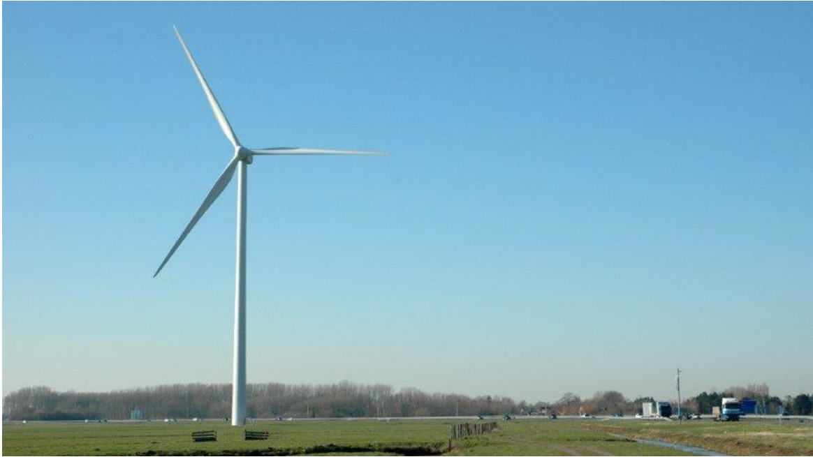
Figuur 2: Windmolen met een tip hoogte tot wel 250 m.

Bent u voor / tegen plaatsing van windmolens langs de N207 (zie figuur 2)?